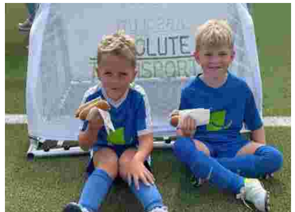
Nach dem Spiel darf man sich ruhig stärken