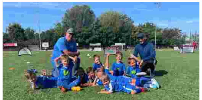
Hurrrrrraaaa Geschafft – Super gespielt Jungs