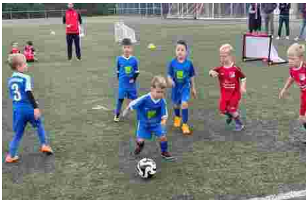
Kampf um den Ball

Insgesamt hatten wir 11 Spielfeste in diesem Halbjahr absolviert. Bei den Spielfesten treten in Regel 8-12 Mannschaften gegeneinander an. Hofheim konnte fast immer zwei Teams zu den Spielfesten entsenden. Die Kinder hatten sehr viele Spaß und entwickeln sich gut zu richtigen Kickern. Aktuell haben wir 26 Kinder an zwei Trainingstagen in unserem Kader. Nun geht es in die Winterpause und wir freuen uns auf neue Spielfest nach der Winterpause.