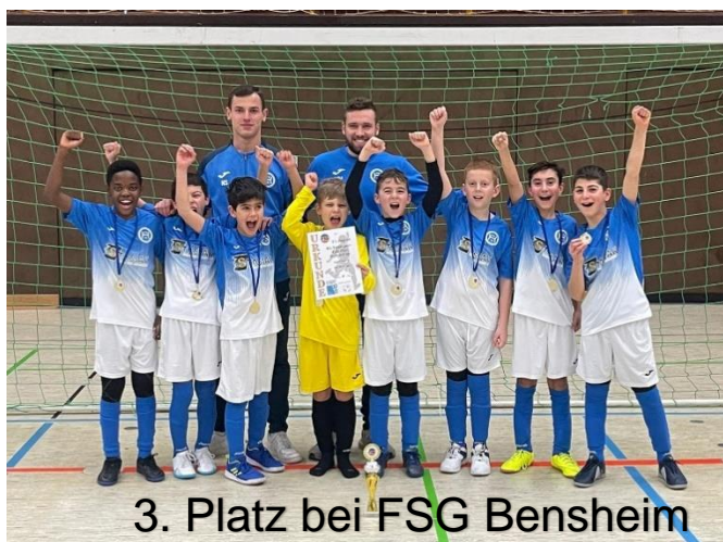
3. Platz bei FSG Bensheim