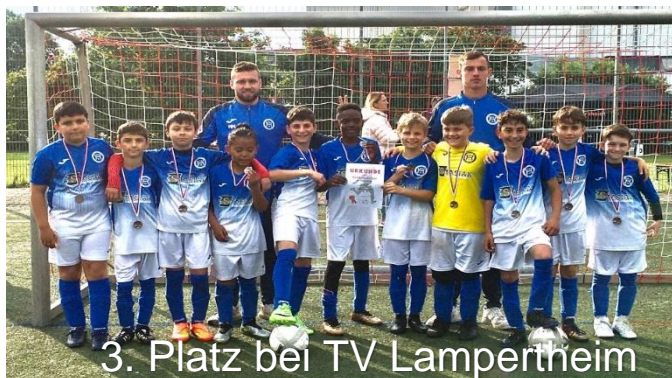
3. Platz bei TV Lampertheim