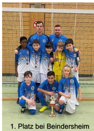
1. Platz bei Beindersheim