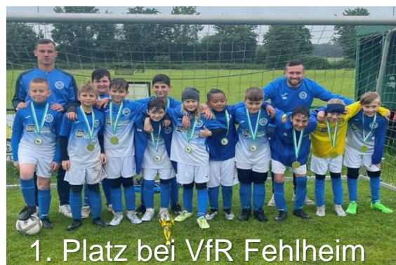
1. Platz bei VfR Fehlheim